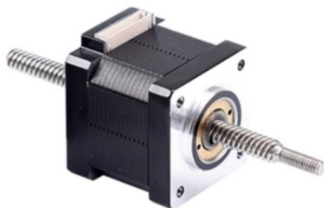
Линейные шаговые двигатели без захвата LN143S, построенные на базе гибридного шагового двигателя NEMA 14